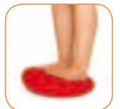
Yksi kuvaston monesta harjoitusehdotuksesta.